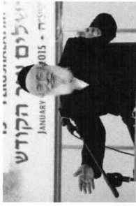
32. Chashukei Chemed R' Yitzchak Zilberstein