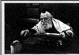
12. Igros Moshe R. Moshe Feinstein (1895-1986)

למחול משום שהוא למנוע איסורא יש להתיר כשלא אפשר עיי דייני ישראל אבל כשאפשר הרי ודאי יש להחשיבו גורם לשבועת שוא.