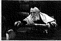
11. Igros Moshe R. Moshe Feinstein (1895-1986)