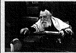
13. Igros Moshe R. Moshe Feinstein (1895-1986)